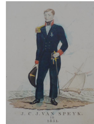
Gravures Jan van Speyk, B.M. Israel Antiquariaat Egmond aan den Hoef.