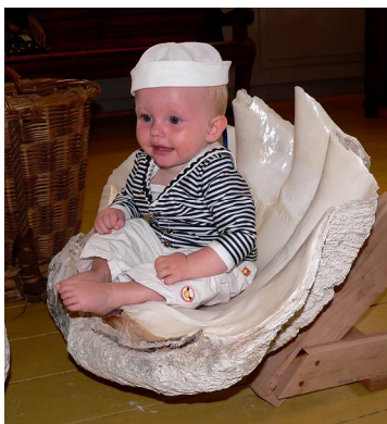
De Doopvontschelp, onderdeel van de tentoonstelling “De wonder- wereld van schelpen” van Piet van Pel.